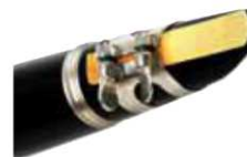
Embocadura de canya doble