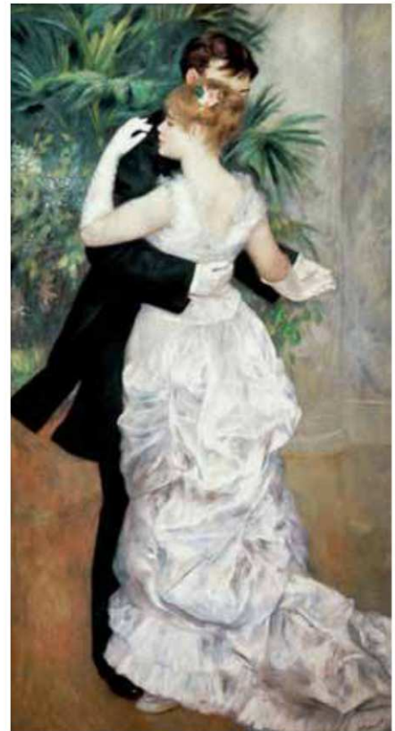
El vals i el minuet són danses ternàries.