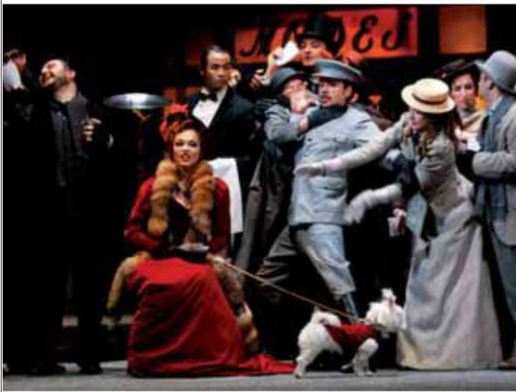
Representació de l'òpera La Bohème , de G. Puccini.